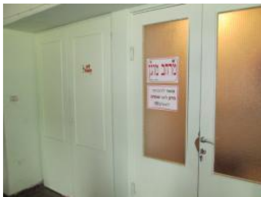
תמונה 2 : אולם הגן